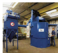
GRANLHADORAS DE MESA ROTATIVA