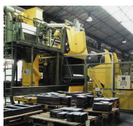
GRANLHADORAS DE TAMBOR COM CINTA METÁLICA