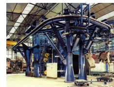
GRANLHADORAS DE CARGA SUSPensa